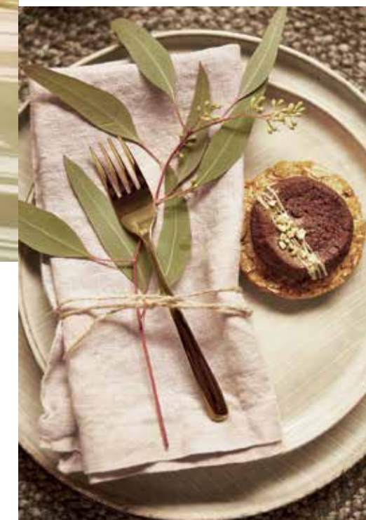
Teríték, evőeszköz, textilszalvéta Butlers Kekszek Egy csipet torta

„Sosem hagyjuk ki a városi sétát karácsonykor a családdal, hol a budai Várban, hol a Dunakanyarban.”