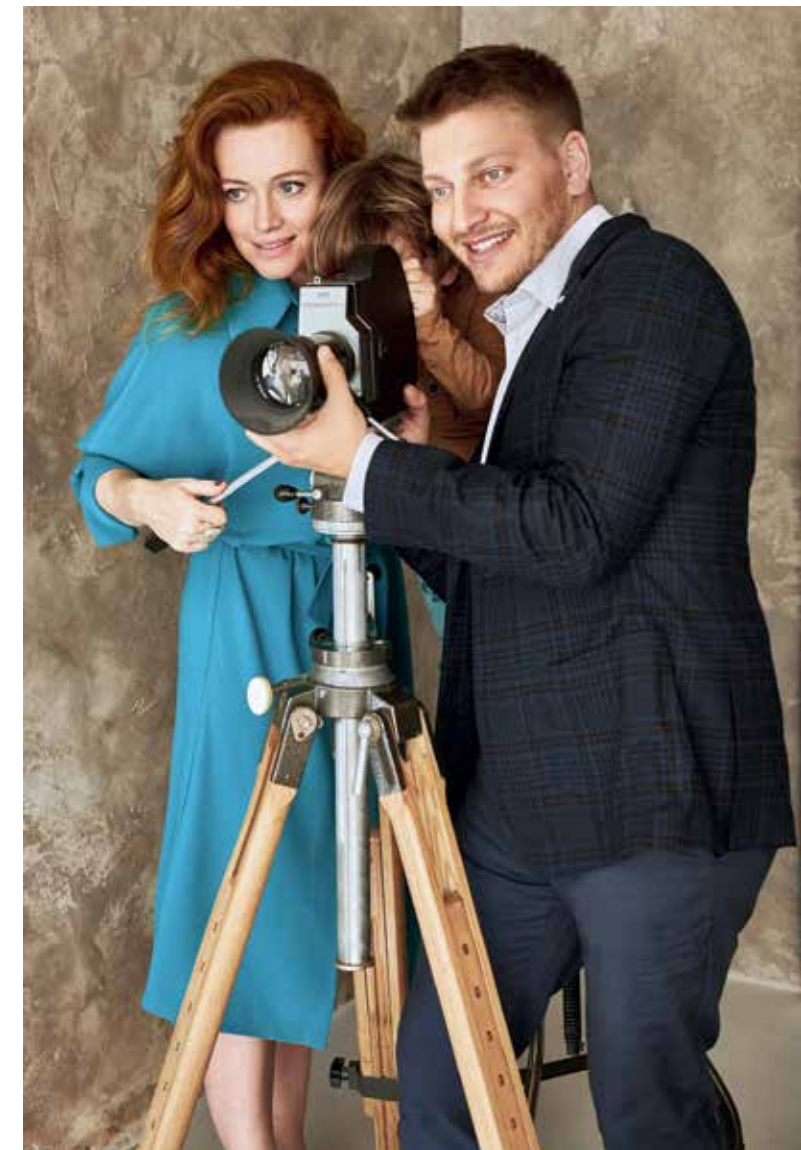
ESZTER Ruha Katti Zoób, 162 900 Ft