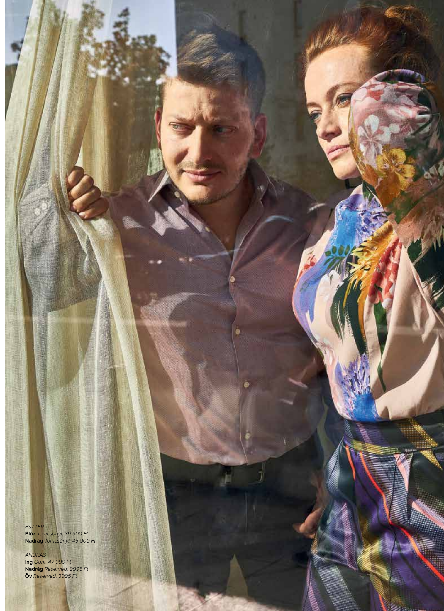
ESZTER Blúz Tomcsányi, 39 900 Ft Nadrág Tomcsányi, 45 000 Ft