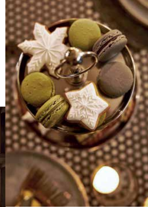
Sütisállvány Butlers Macaronok Egy csipet torta Mézeskalács csillagok Chouchou – Czakó Kert