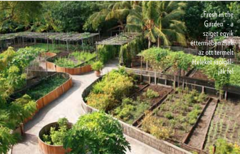
„Fresh in the Garden” - a sziget egyik éttermében csak az ott termelt ételeket szolgálják fel