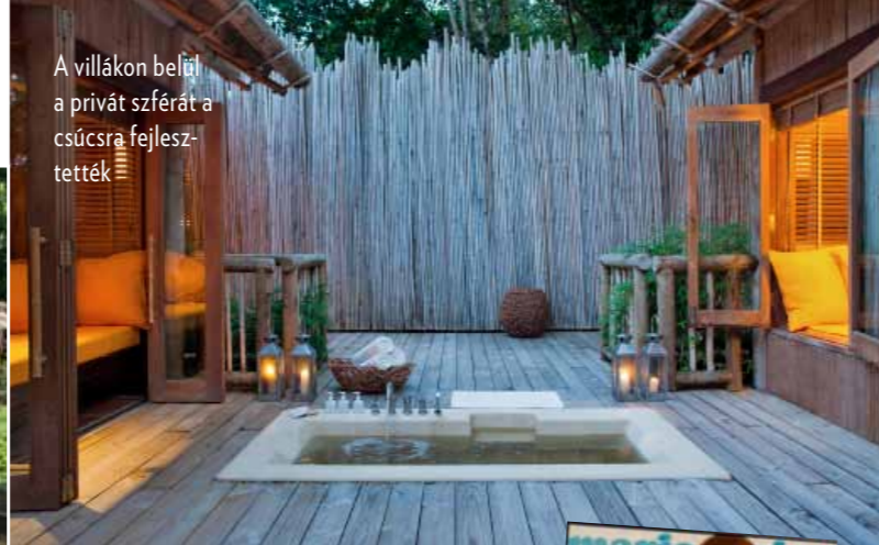
A villákon belül a privát szférát a csúcsra fejlesztették