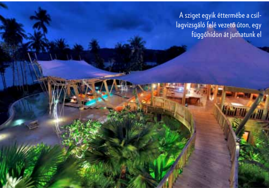
A sziget egyik éttermébe a csillagvizsgáló felé vezető úton, egy függőhídon át juthatunk el