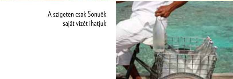
A szigeten csak Sonuék saját vizét ihatjuk