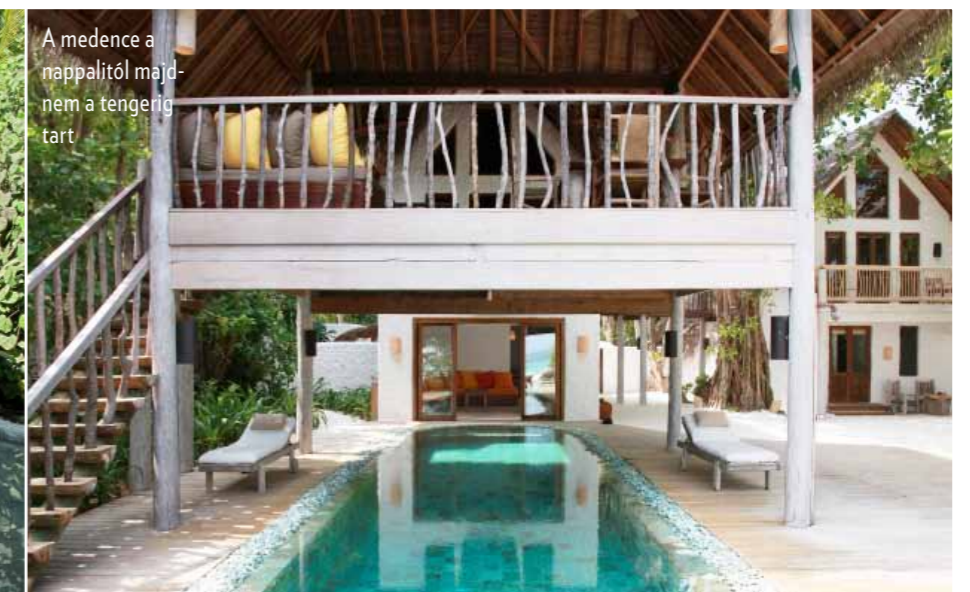
A medence a nappaltól majdnem a tengerig tart