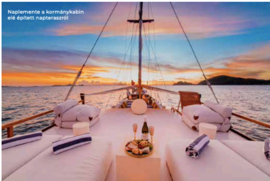
Naplemente a kormánykabin elé épített napteraszról