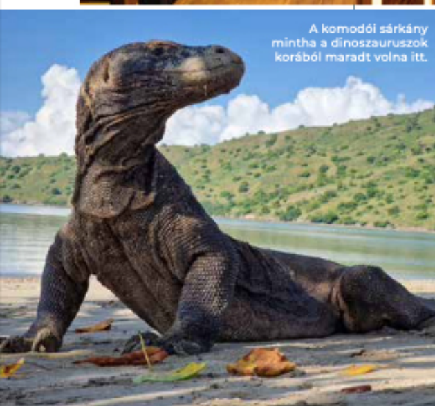
A komodói sárkány mintha a dinoszauruszok korából maradt volna itt.