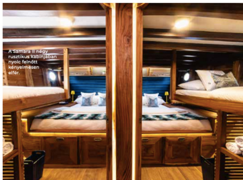
A Samara II négy rusztikus kabinjában nyolc felnőtt kényelmesen elfér.