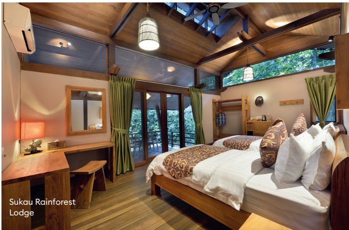
Sukau Rainforest Lodge