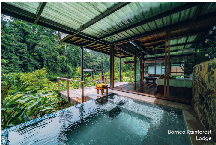
Borneo Rainforest Lodge