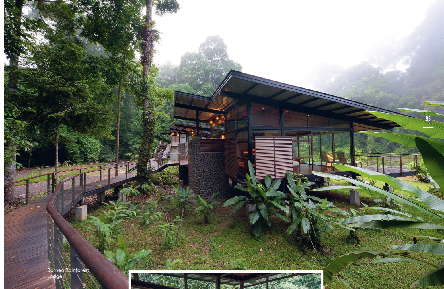
Borneo Rainforest Lodge

ugyanis ötödannyi földre van szükség egy liter pálmaolajhoz, mint egy liter repce- vagy napraforgóolaj kitermeléséhez. Csakhogy a becslések szerint 2035-re kétszer annyi pálmaolajra lesz szüksége az emberiségnek, mint most.