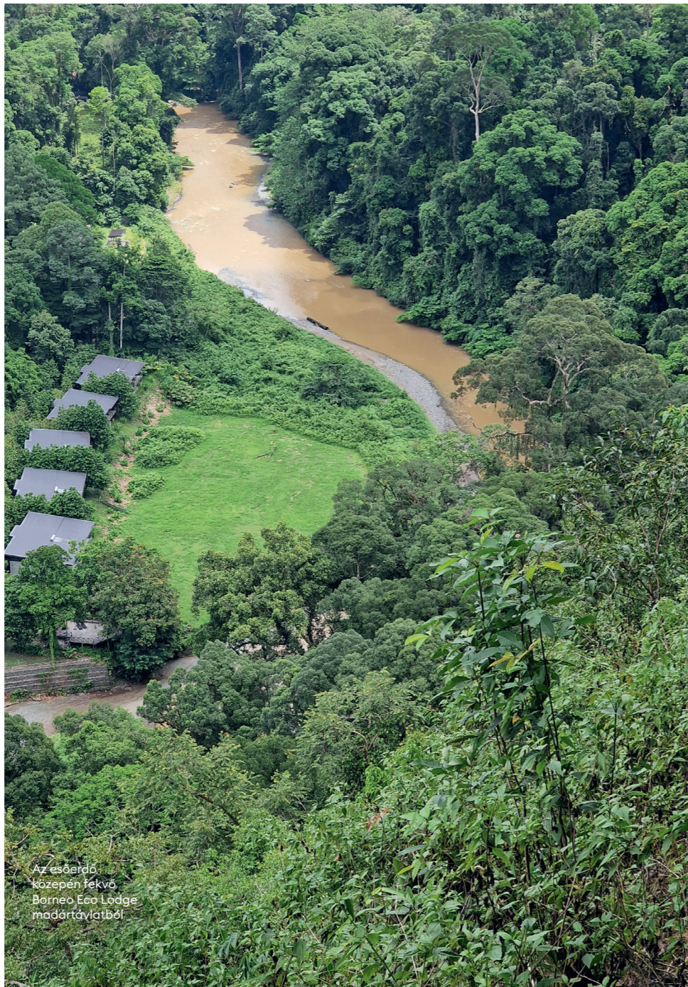
Az esőerdő közepén fekvő Borneo Eco Lodge madártávlatból

A Kuala Lumpur-i repülőtéren landolva megkönnyebbülés, hogy a másnap hajnali járat előtt már nem kell bevergődni egyik kedvenc délkelet-ázsiai metropoliszunkba, ami további egy óra autózás lenne az esti csúcsgalamban, hanem a Sama-Sama nevű reptérhotelben töltjük az éjszakát. Alig lépünk ki a gépből, már ott várnak a szálloda munkatársai, és mintha még az útlevél-ellenőrzést is meggyorsítanák. A recepció jéghideg nedves kis törülközőt nyomnak a kezünkbe, a szobában helyi édes-ségek várnak, az ágy és az ágynemű végtelenül kényelmes, a szoba teljesen besötétíthető, és másnap kipihenve ébredünk. Ilyen se fordult még elő