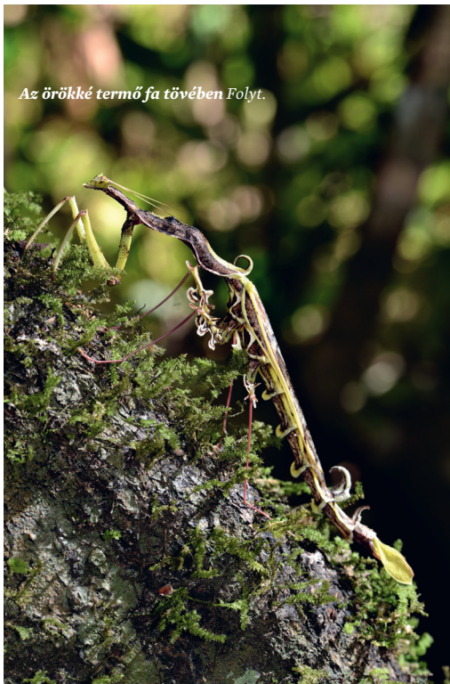
Az örökké termő fa tövében Folyt.